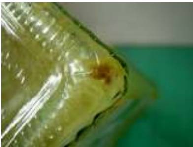
A: 白濁している状態 角に茶色く異物に見えます。