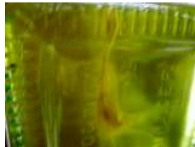
B: 室温に戻し液化した状態 もやもやとした異物。